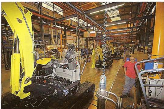
Kokoamislinjalta valmistuu 27 konetta päivässä.