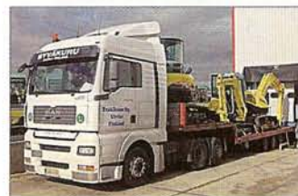
Syväkuru Yhtiöt toimittaa ammattitaidolla viikottain koneet Ranskasta Suomeen.

Tänä vuonna markkinoille tulivat uudet 4. sukupolven koneet Vio 50 ja Vio 57. Tavoitteena on joka vuosi tuoda muutama uusi malli