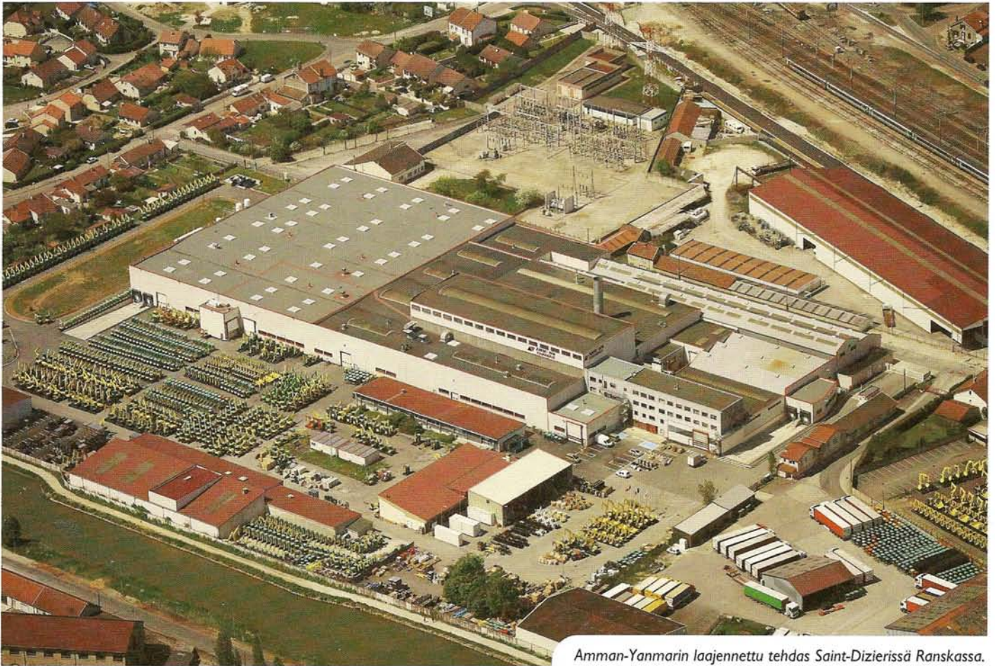
Amman-Yanmarin laajennettu tehdas Saint-Dizierissä Ranskassa.