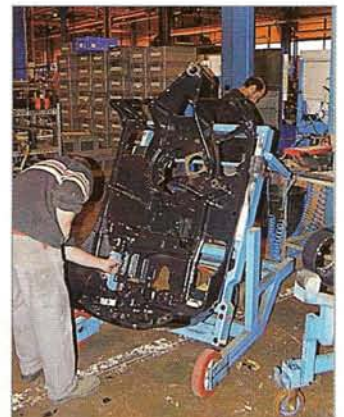
Yhdestä kappaleesta valettu alustan ylävaunurunko takaa saumattoman alustan komponenteille.

markkinoille ja vuoteen 2012 mennessä on koko mallisto uudistunut.