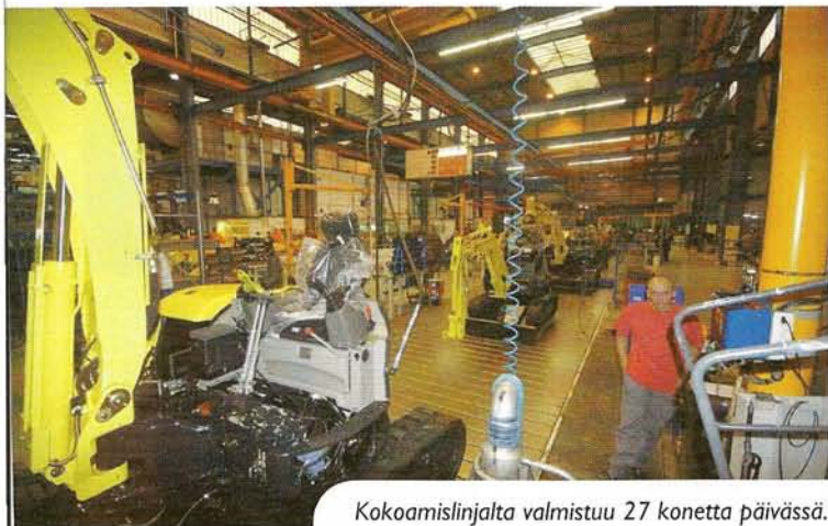
Kokoamislinjalta valmistuu 27 konetta päivässä.