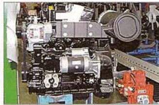
japanilainen Yanmar moottorin on koneiden sydän.