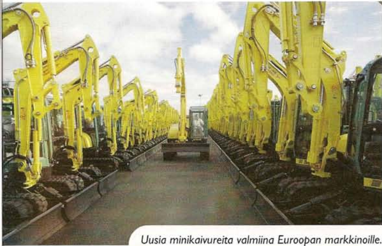
Uusia minikaivureita valmiina Euroopan markkinoille.