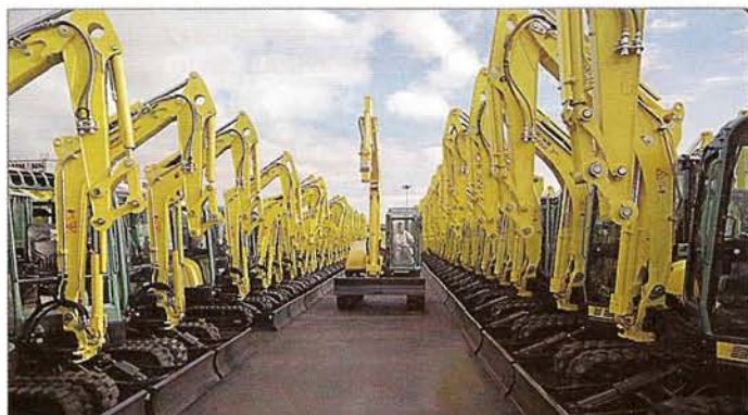
Puskurivarastoa Euroopan markkinoille.

Ammann-Yanmarilla on kattava jälleenmyyntiverkosto Euroopassa, jossa on tällä hetkellä noin 120 jälleenmyyjää. Yritys satsaakin vahvasti