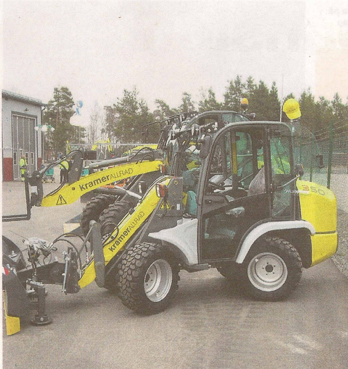
Försäljningen tar fart. Sedan sortimentet utökades med Kramer Allrad i september förra året har sex hjullastare av fabrikatet sålts.

Wille. Kan inte det skapa problem hos er?