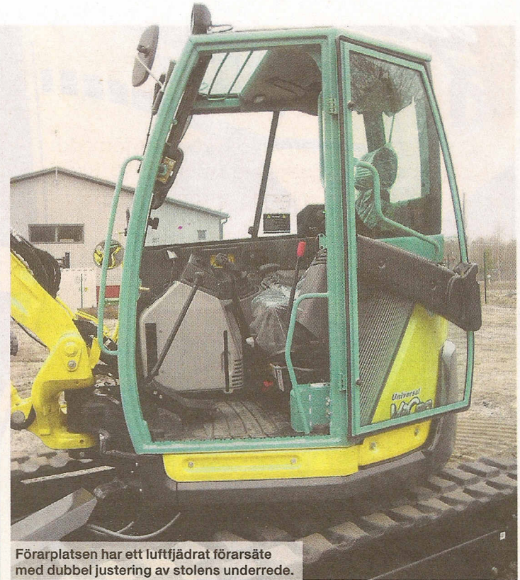
Förarplatsen har ett luftfjädrat förarsäte med dubbel justering av stolens underrede.